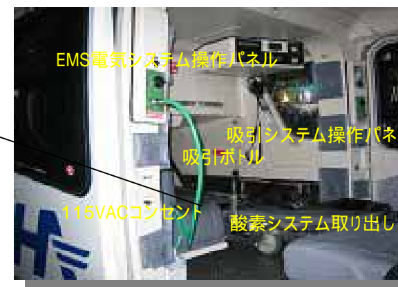
EMS電気システム操作パネル